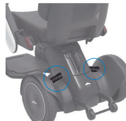
Die Hinterradfederung dämpft die Stöße beim Fahren über holprige Straßen oder Hindernisse.