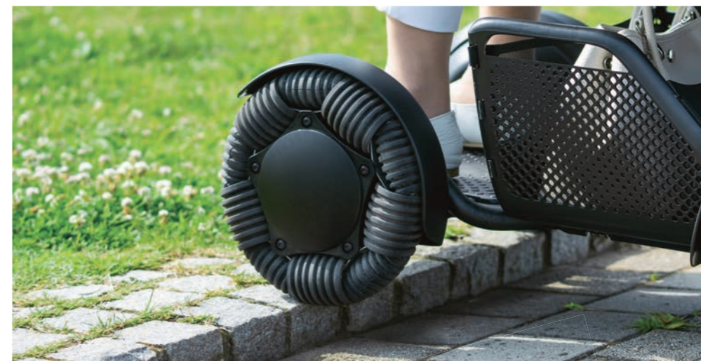
Überwinden Sie mühelos Hindernisse bis zu 5 cm Höhe.

Dank zweier leistungsstarker Motoren und innovativer Räder können Sie mit dem WHILL Model C2 Gelände befahren, für das ein handelsüblicher Elektrorollstuhl ungeeignet ist. Schlaglöcher, unebenes Gelände, Gras und Schotter sind kein Problem.