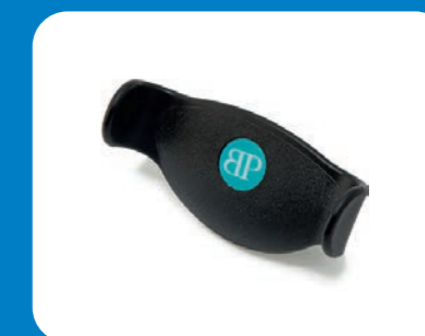
Typ Steuerknopf u-förmig

Komfort-Armauflage (kein medizinisches Produkt)