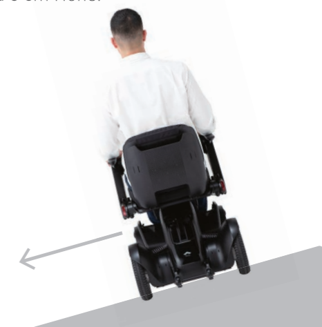
Das WHILL Model C2 wurde entwickelt, um ein Abdriften zu verhindern. Fahren Sie auf einem geneigten Weg geradeaus.